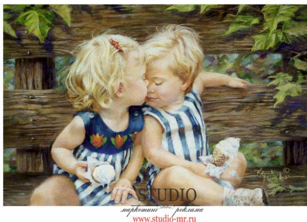
Проект: Счастливое Детство